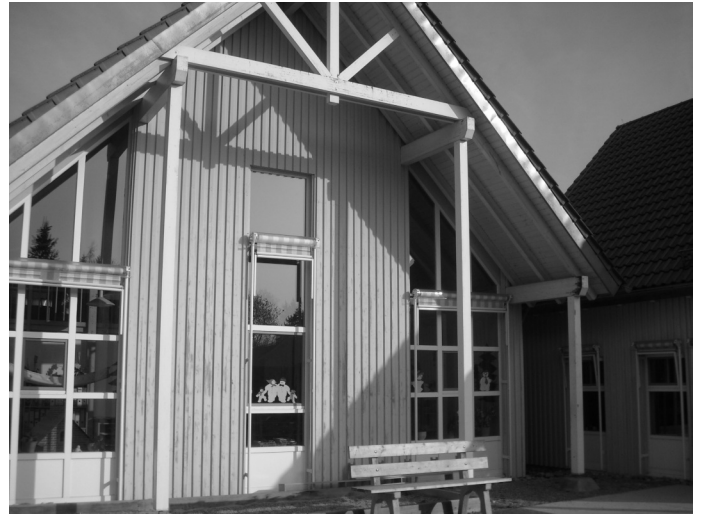
Die Holzfassade und die Vordachkonstruktion erhalten einen Überholungsanstrich und es wird ein zusätzlicher Sonnenschutz an den oberen Giebelfenstern angebracht

Der Kindergarten „Arche Noah“ wurde in den Jahren 1996/1997 erbaut. Die Verwaltung erinnerte daran, dass bereits in den vergangenen Jahren regelmäßig in die Unterhaltung des Kindergartens investiert wurde. So wurde der „Spielplatzbereich“ grundlegend saniert, die Sandkastenanlage erneuert, die Holzbeläge im Außenbereich durch Steinbeläge ersetzt und der Laubengang im hinteren Eingangsbereich auf Grund des schlechten Zustandes entfernt.