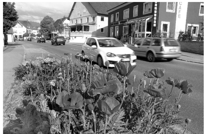
Bericht/Foto: Olaf Schulze

Auskunft erteilt Frau Born auf dem Rathaus 07565/9800-11, sie stellt auch den Kontakt zum Gartenbauverein her.