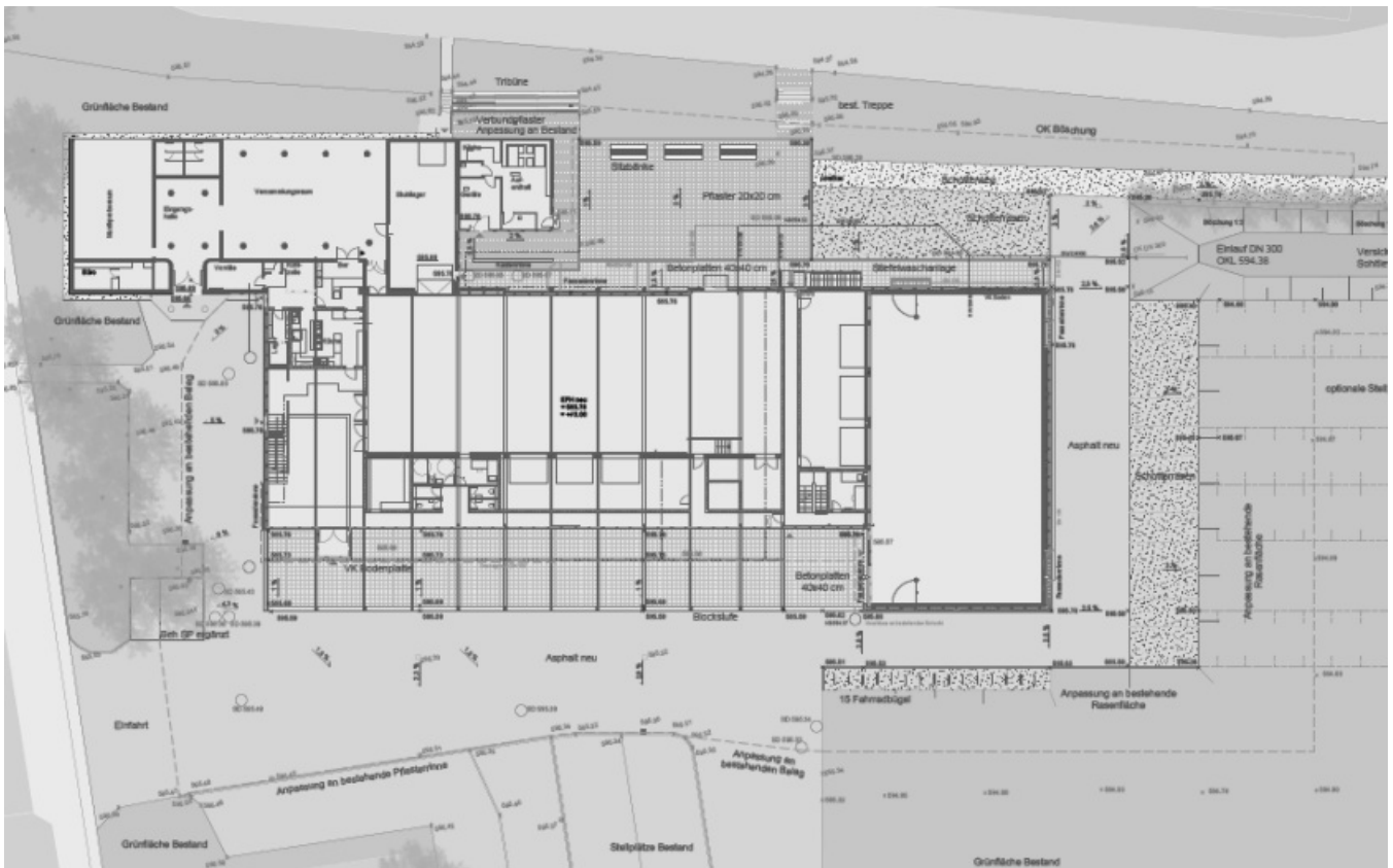
Die Planung der Außenanlagen im Überblick

Der Gemeinderat stimmte der Planung der Außenanlagen mit diesen Maßgaben zu und beauftragte die Verwaltung die Arbeiten auszuschreiben. Da die Ausführung der Arbeiten nur „am Stück“ sinnvoll und kostengünstig bewältigt werden kann, war man sich einig, dass der Zugang zu der Sporthalle nach den Sommerferien den Nutzern provisorisch mittels einer sauberen Kiesschicht ermöglicht wird.