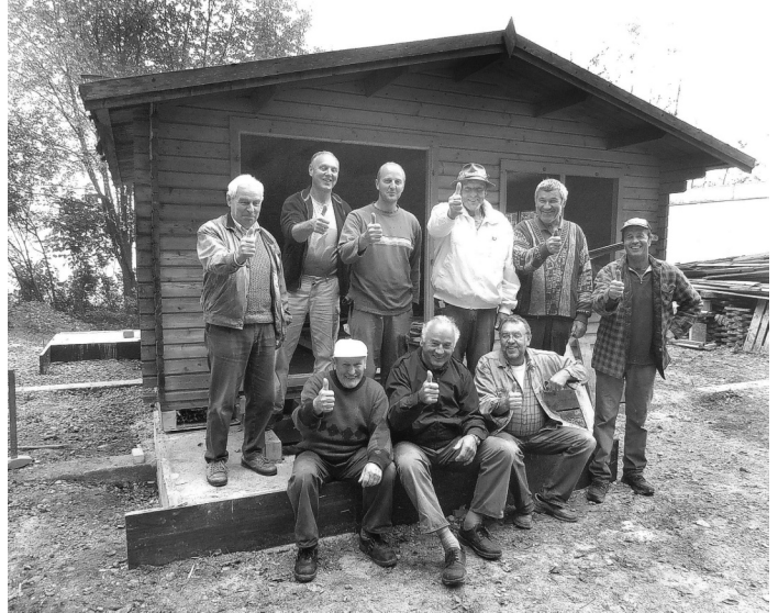
Eine "Punktlandung" gelang Mitgliedern des Imkervereins Aitrach und deren Helfern beim Umzug einer Holzhütte zum neuen Standort im Illergries und dem Aufsetzen auf das hölzerne Fundament. Die Hütte wird künftig als Lehrbienenstand genutzt.